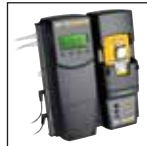
Compatible con MicroDock II