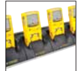
Cargador soporte de cinco unidades

Para obtener la lista completa de accesorios, póngase en contacto con BW Technologies by Honeywell.