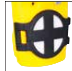
Equipo de filtros auxiliares