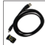
Equipo de conectividad infrarrojo